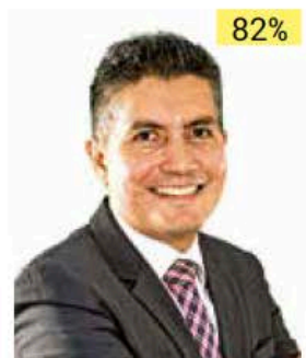
Miriam Guadalupe Hinojosa Dieck Exconsejera de la Comisión Estatal Electoral de Nuevo León.