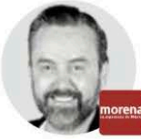
RUMBO POLÍTICO ARTURO ÁVILA Vocero de Morena en la Cámara de Diputados @arturoavila_mx