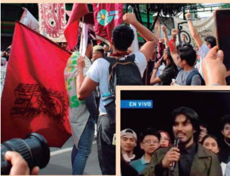
La semana pasada estudiantes del IPN irrumpieron en Canal Once para transmitir en vivo un pliego petitorio. Denunciaron mal manejo de recursos y exigieron la renuncia del director, Arturo Reyes Sandoval.

Quizá aquella vieja broma del crimen perfecto: tirar un cadáver en el Canal 11 de TV donde nadie lo vería, se está cumpliendo ahora. Ni quien se dé por enterado •