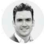
JORGE ROMERO HERRERA Presidente del Partido Acción Nacional @JorgeRoHe