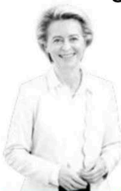
URSULA VON DER LEYEN

Protocolo de visita de estado tendrán en México la presidenta de la Comisión Europea, Ursula von der Leyen , y el presidente del Consejo Europeo, António Costa , quienes el viernes firmarán con la presidenta Sheinbaum el Acuerdo Global Modernizado entre nuestro país y el viejo continente. Ambos tendrán diversas actividades este jueves, según dio a conocer el canciller Roberto Velasco . Ella visitará el Museo de Antropología, caminará por Chapultepec y se reunirá con mujeres indígenas. Él va al Congreso de la Unión y recorrerá el Templo Mayor.