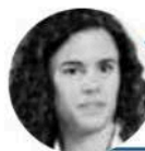
LUISA MARÍA ALCALDE

Ahora el PAN convocó a una movilización en defensa de la gobernadora de Chihuahua, Maru Campos . El dirigente albiazul, Jorge Romero , busca mostrar músculo en la entidad norteña “con la marcha más grande de la historia”, luego de la protesta del sábado pasado organizada por Morena. En los próximos días se darán a conocer la fecha y la hora.