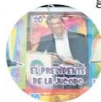
El presidente de la Jucopo

●● Nos cuentan que la revista institucional de la Cámara de Diputados decidió lanzar una versión de la lotería mexicana para “acercar el Congreso a la gente”. Nos hacen notar que entre las tarjetas hay una que brilla con luz y sonrisa propia, la de “El Presidente de la Jucopo”, donde aparece Ricardo Monreal . A Monreal lo hemos visto en motocicletas, en videos de rap y hasta en videojuegos, y ahora lo veremos impreso en este capricho a cargo del erario. No cabe duda de que en San Lázaro alguien está endiosado con la figura de don Ricardo. ¿O será él al que le gusta ver su imagen hasta en la lotería?