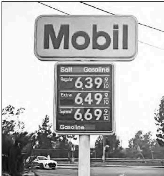
▲ El subsidio del gobierno mexicano a la gasolina Magna y el caos en el mercado de Estados Unidos ha hecho que la mexicana sea más barata que al otro lado de la frontera. Foto tomada ayer en Glendale, California

X, Facebook, TikTok, Instagram: galvanochoa • Correo: galvanochoa@gmail.com