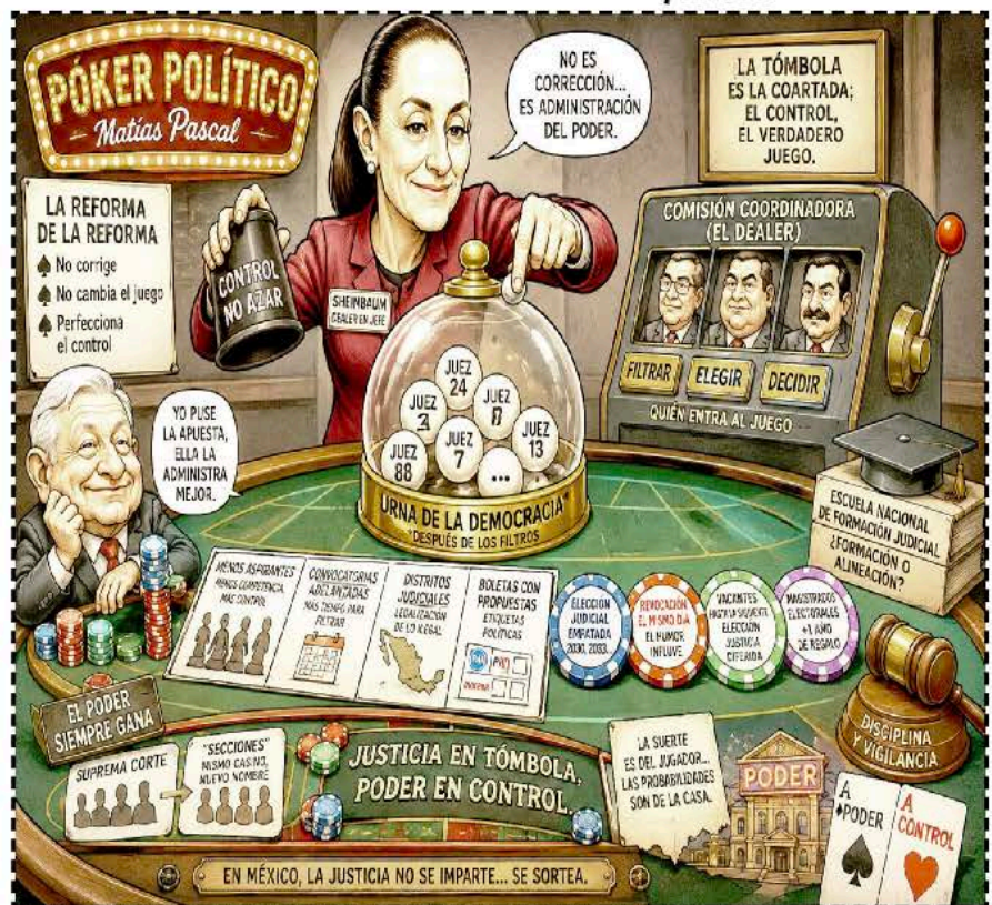
EN MÉXICO, LA JUSTICIA NO SE IMPARTE... SE SORTEA.

La justicia, convertida en sorteo. La independencia, convertida en discurso. Y el poder -como siempre- quedándose con la banca. ¡Ciaooo!