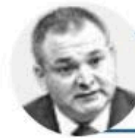
GENARO GARCÍA LUNA

Impecable operativo coordina el secretario de Seguridad, Omar García Harfuch , para dismantlar una red criminal en Morelos, integrada por alcaldes, ex alcaldes, funcionarios y empresarios ligados al crimen organizado. Hay capturas y órdenes de aprehensión por cumplimentarse. Los señalan de extorsiones, amenazas y cobro de piso.