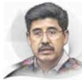
Hugo Aguilar Ortiz