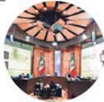
Sede del TEPJF

Mientras a la mayoría de los juzgadores la primera reforma judicial les truncó la carrera, los cuatro magistrados no hacen más que ganar. Al estilo de Belinda: ganando como siempre.