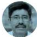
HUGO AGUILAR ORTIZ

► Se reunió el secretario de Marina, Raymundo Pedro Morales , con el embajador de Estados Unidos en México, Ronald Johnson , y el jefe del Comando Norte, Greg Guillot . En el encuentro, en la Ciudad de México, hablaron sobre cooperación para capacitar a cadetes, con miras a fortalecer la coordinación en seguridad marítima y regional.