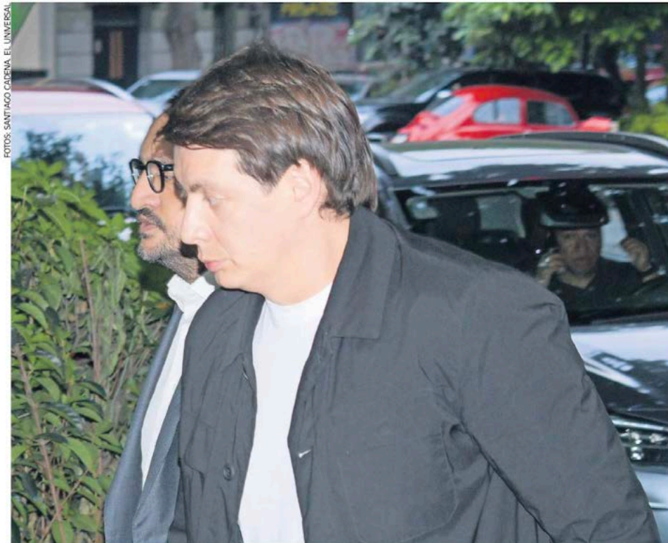
El plan de Andrés Manuel López Beltrán es quitarle al PRI la mayoría en el Congreso estatal de Coahuila.

Los diputados consultados por EL UNIVERSAL coincidieron en que no hay una indicación de adelantarse a las campañas oficiales, pero sí de prestar su talento, experiencia, recursos humanos y materiales a los candidatos al Congreso de Coahuila. ●