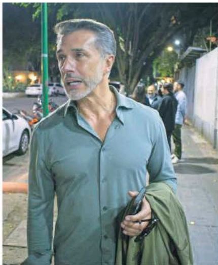
Sergio Mayer estuvo presente en la reunión de Morena la tarde del lunes 20 de abril.

En lo que corresponde a resultados electorales, basta con una convocatoria a sesión extraordinaria del Consejo Nacional para destituir a miembros del CEN y votar a los nuevos integrantes. Dicha reunión se llevaría a cabo posterior-