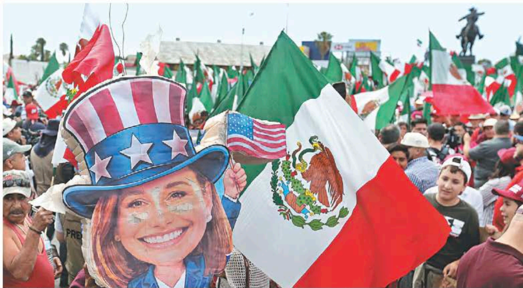
Cerca de 20 mil chihuahuenses marcharon en la entidad en defensa de la patria. ARIEL OJEDA

H ay algo profundamente equivocado en la estrategia narrativa de la oposición. Y no solamente equivocado: peligroso.