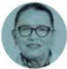
ROSA ICELA RODRÍGUEZ

► Puso orden la presidenta Claudia Sheinbaum , en los partidos que integran la 4T, los cuales se estaban yendo por su lado de cara a la elección intermedia de 2027. En la reunión que sostuvo el jueves pasado en Palacio Nacional con diputados, senadores y los dirigentes de Morena, Luisa María Alcalde , del PVEM, Karen Castrejón , y del PT, Alberto Anaya , la mandataria federal les pidió mantener la alianza total. El anuncio formal lo harán público en los primeros días de enero de 2026.