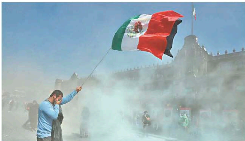
Un grupo de provocadores desprestigió la protesta. JESÚS QUINTANAR