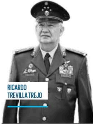
RICARDO TREVILLA TREJO

El Gabinete de Seguridad, especialmente la Secretaría de la Defensa Nacional, dirigida por el general Ricardo Trevilla Trejo , se llevó todas las palmas y el reconocimiento de la sociedad mexicana por el operativo en Jalisco, donde resultó abatido el jefe del Cártel Jalisco Nueva Generación (CJNG) , Nemesio Oseguera Cervantes , El Mencho . Con toda seguridad, la acción significará un antes y un después en el historial criminal de este peligroso grupo delictivo que por muchos años generó caos e inestabilidad en diferentes estados del país, así como en distintas regiones de Estados Unidos y del mundo.