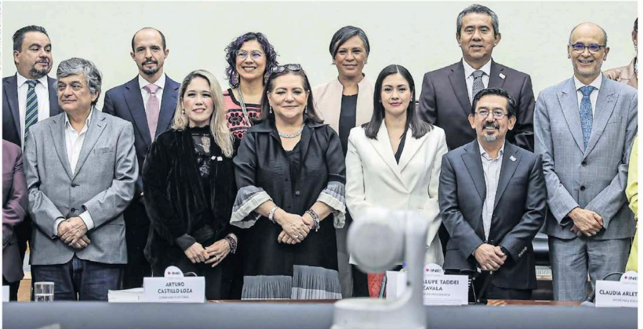
Durante la sesión del Consejo General del INE, los tres nuevos consejeros rindieron protesta y presentaron su visión sobre los trabajos que debe tomar el organismo electoral.

—ALEJANDRA CANCHOLA —nacion@eluniversal.com.mx