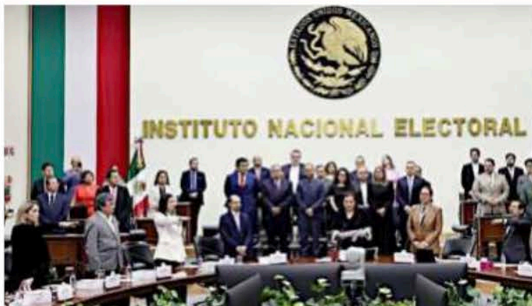
Los tres nuevos integrantes del INE rindieron protesta ayer en sesión del Consejo General.

“La función electoral en democracia constituye un quehacer de alta exigencia técnica y procedimental, desplegado desde los valores democráticos y consciente de su importancia”.