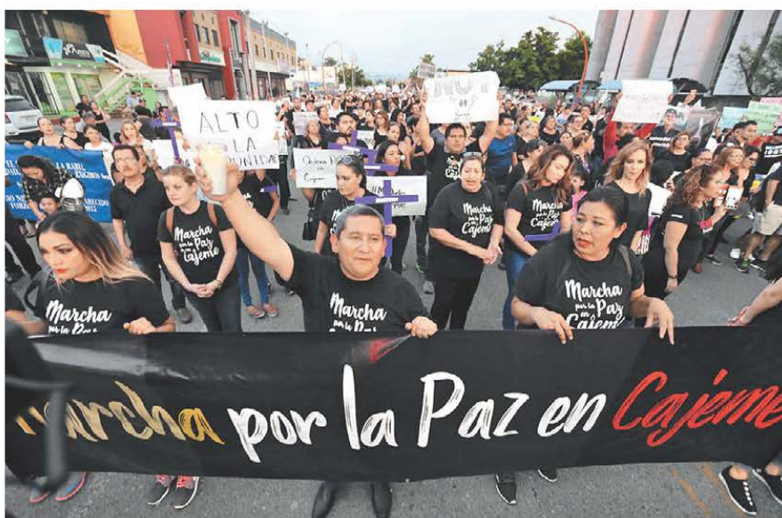
Entre las presiones que alteran la forma en la que se ejerce el poder está el impacto del crimen. J. RÍOS

mocracia, el desarrollo humano y el Estado. Cuando uno de esos pilares se debilita, el sistema entero se resiente. En la realidad actual, este triángulo debe resistir presiones emergentes que están alterando la forma en que se ejerce el poder: la polarización tóxica, el impacto del crimen organizado, el uso insuficientemente regulado de la inteligencia artificial y la desinformación en las redes sociales, la movilidad humana y la triple crisis planetaria (cambio climático, pérdida de la biodiversidad y contaminación).