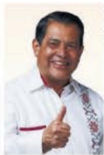
Juan de la Rosa.

:::: Con un avance reportado de 52% en apenas mes y medio, la rehabilitación del Periférico Norte se ha convertido en una de las apuestas más visibles del gobierno estatal para revertir años de deterioro en una vialidad por la que circulan más de 200 mil vehículos al día. La presencia del secretario de Movilidad, Juan Hugo de la Rosa , en los recorridos de supervisión subraya que no se trata sólo de repavimentar 108 kilómetros, sino de coordinar infraestructura, seguridad y operación metropolitana en una arteria estratégica para seis municipios. La inversión superior a mil 200 millones de pesos obliga a que el discurso de "cambio total de imagen" se traduzca en calidad técnica, durabilidad y orden vial sostenido; el desafío no es únicamente concluir el 30 de abril, sino garantizar que esta intervención marque un antes y un después en la movilidad del Valle de México.