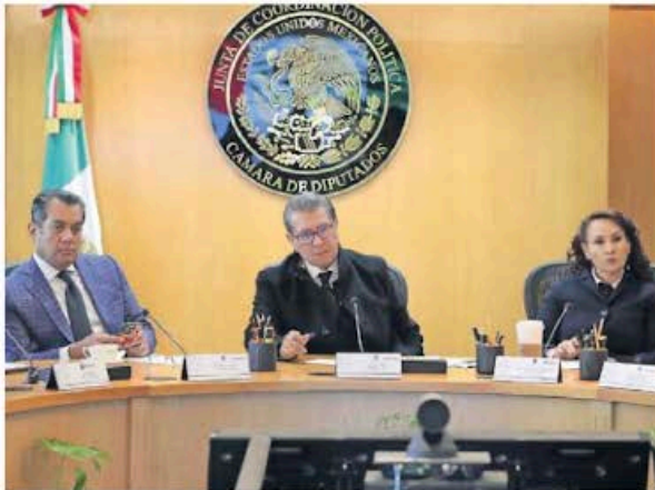
Ricardo Monreal explicó que con la reforma queda la misma fórmula de integración de las Cámaras.