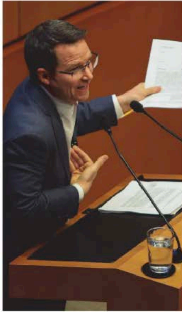
Ricardo Anaya, líder del PAN en el Senado

De hecho Anaya consideró que la Reforma Electoral no pasará pues no cuen-