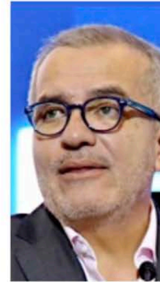
■ Luis Carlos Ugalde, ex presidente del INE

"Personas cercanas a partidos o Gobiernos podrían infiltrarse y sesgar la organización electoral", in-