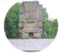
Museo de Antropología

D00001-N-18-2026, el INAH detalla que se llevarán a cabo trabajos de mantenimiento en sanitarios, instalación eléctrica, además de la limpieza a profundidad de la fuente de Tláloc, emblema del Museo. A ver si acaban antes de que ruede el balón.