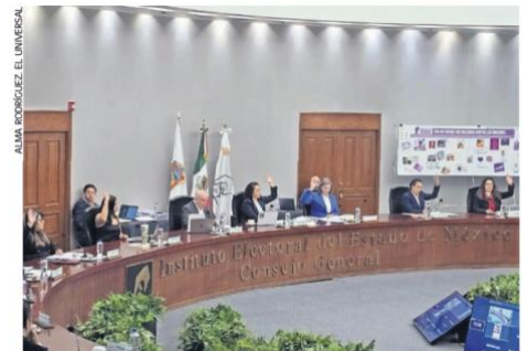
Se especificó que la propuesta considera rubros indispensables para la operación y preparación institucional.