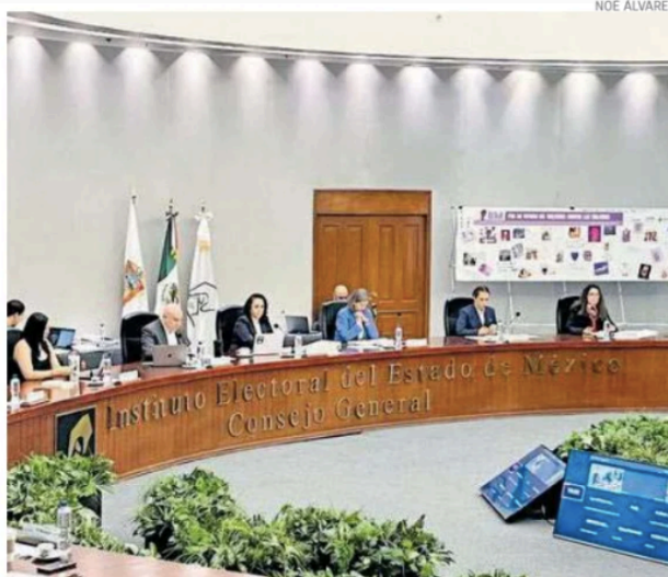
Durante la sesión, se cuestionó la efectividad del gasto en redes sociales y la renta de inmuebles

Entre los principales rubros contemplados se encuentran el pago complementario de sueldos y prestaciones del personal electoral, la contratación de recursos humanos adicionales para tareas iniciales del proceso, así como servicios básicos y