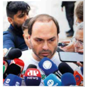
Visita. Carlos Bolsonaro dijo que su padre está devastado psicológicamente.

La celda cuenta con una cama individual, una mesa pequeña, un televisor y estanterías de madera; las paredes son blancas y carecen