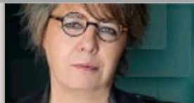
GABRIELA WARKENTIN @warkentin

Entre ignorar, escuchar o atacar, la Presidenta eligió endurecerse. Su decisión revela un estado de ánimo político. Se cancela la interlocución y la empatía.