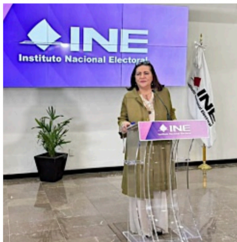
ALERTA. La presidenta del INE, Guadalupe Taddei, dijo que la población no se puede quedar sin datos el día de la elección.

Tras la presentación de los 10 puntos guía de la reforma electoral, la titular del órgano electoral consideró que deben tomarse –de momento– como un reto, incluida la propuesta de que el INE