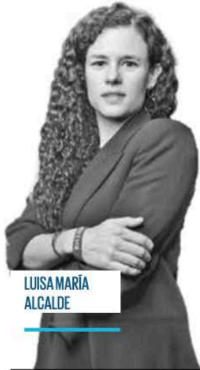
LUISA MARÍA ALCALDE