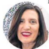
Kenia López Rabadán

●● En contraste con las legislaturas locales con mayoría morenista, en la Cámara de Diputados parece que se toman muy en serio eso de que el descanso es un derecho humano. Nos cuentan que tras la aprobación del Plan B casi al filo de la medianoche del miércoles en el Senado, los papeles volaron a San Lázaro con la urgencia que el caso ameritaba y en la madrugada del jueves la Mesa Directiva, que preside la panista Kenia López Rabadán , anunció que recibió la minuta y la turnó de inmediato a comisiones. Pero no se confunda, no es que los diputados tuvieran prisa por dictaminar o abrir el debate técnico de la reforma. Apenas tocó el documento el escritorio de las comisiones, sonó el “campanazo” de salida. Sin más trámite, se dio por terminada la sesión y se emitió la convocatoria para el 7 de abril. En San Lázaro bajaron la cortina, apagaron las luces y colgaron el letrero de “Cerrado por vacaciones”. Primero el Plan V, pues.