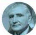
ADÁN AUGUSTO LÓPEZ