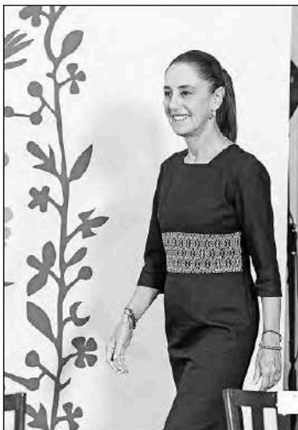
▲ Si hay que investigar algún delito por la presencia de agentes de la CIA en Chihuahua debe hacerlo la FGR, advirtió ayer la mandataria federal.