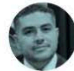
OMAR GARCÍA HARFUCH

► Rindió el gobernador de Sinaloa, Rubén Rocha , su Cuarto Informe de Gobierno ante el Congreso estatal. El mandatario se refirió a la preocupación por la inseguridad en varios sectores de la entidad, pero destacó que con la estrategia coordinada con el gobierno federal "hemos avanzado, no hemos terminado todavía".