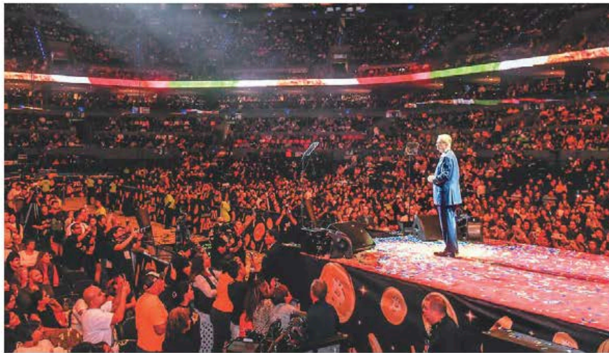
Personajes como Ricardo Salinas usan de manera vociferante la palabra “libertad”.

Si la izquierda moderna celebra la diversidad, la derecha enfatiza la distinción. No son lo mismo. La diversidad es el reconocimiento horizontal de las diferencias en un plano de igual-