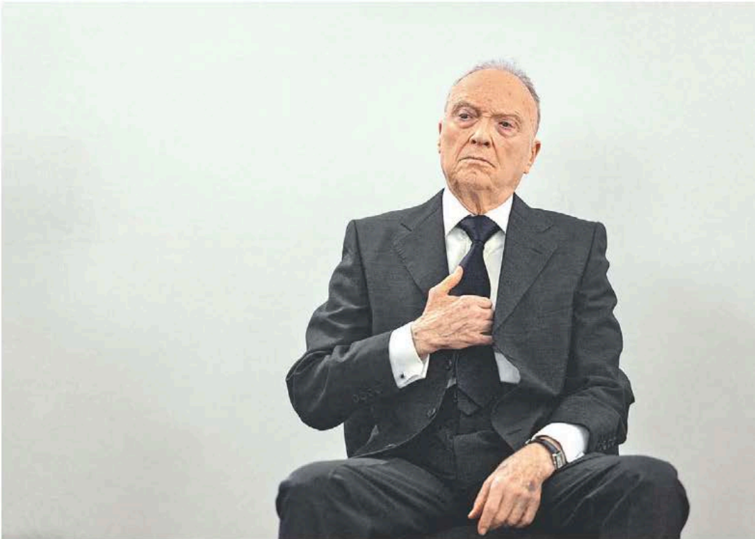
El documento dice que la doctora Sheinbaum lo propuso como diplomático.

Será por vanidad o por orgullo –difícilmente lo sabremos– en los hechos la jubilación quedó descartada como razón de su dimisión; si no es por una embajada y tampoco por su edad, ¿qué fue lo que realmente motivó el cambio en la fiscalía?