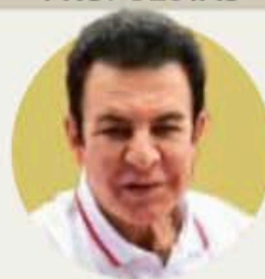
SALVADOR NASRALLA (PARTIDO LIBERAL)