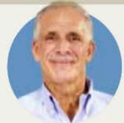
NASRY ASFURA (PARTIDO NACIONAL)