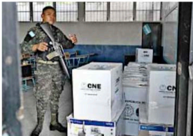
■ Un soldado vigila varias cajas con boletas para la votación en un colegio electoral de la ciudad de Tegucigalpa.

Moncada, su ex Secretaria de Finanzas y Defensa, para sucederla. Pero la candidata oficialista se enfrenta a una profunda frustración entre los votantes por cuestiones como los precios altos, el desempleo, la seguridad y las acusaciones de corrupción.