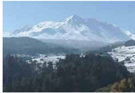
La presencia de hielo, neblina y viento mantiene alto el riesgo de accidentes

OTRO EMPATE PARA EL TRICOLOR ANTE BELGICA trofeo 1C