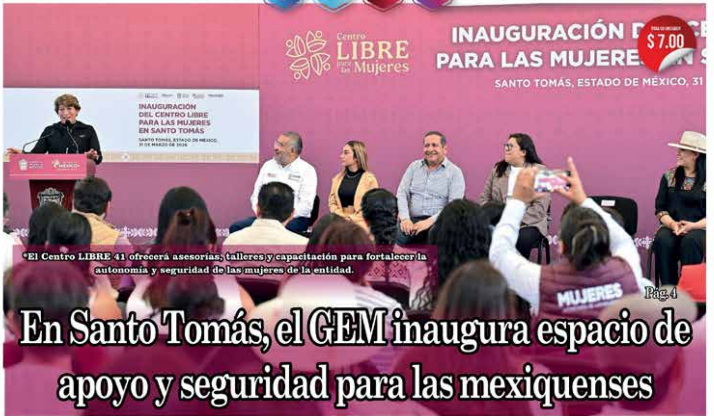
El Centro LIBRE 41 ofrecerá asesorías, talleres y capacitación para fortalecer la autonomía y seguridad de las mujeres de la entidad.