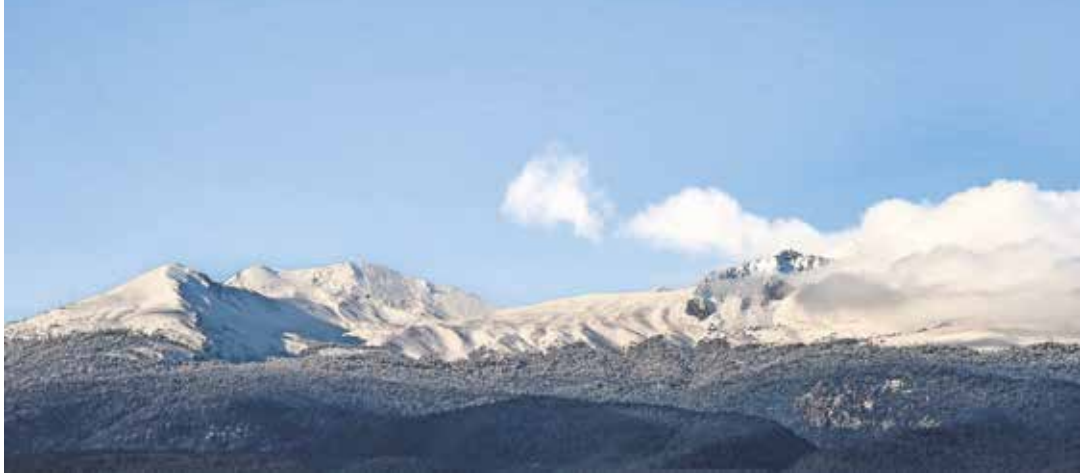
ALEJANDRO VARGAS, EL UNIVERSAL