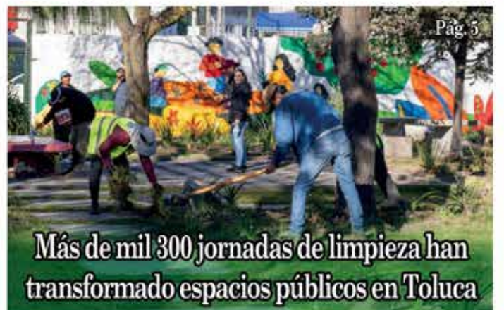
Más de mil 300 jornadas de limpieza han transformado espacios públicos en Toluca