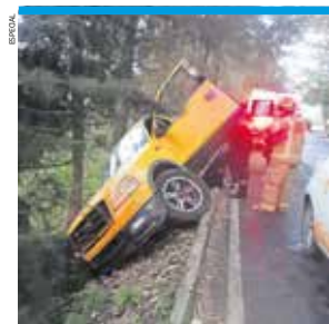
EXCESO DE VELOCIDAD