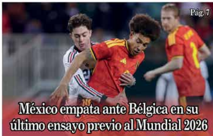
México empata ante Bélgica en su último ensayo previo al Mundial 2026