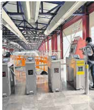
Actualmente, los usuarios del Tren Felipe Ángeles Buenavista-AIFA solo pueden recargar su tarjeta en cuatro máquinas.

Usuarios del servicio ferroviario hacia el Aeropuerto Internacional Felipe Ángeles enfrentan fallas en la operación: no hay máquinas de recarga en estaciones y solo algunas cuentan con lectores para la tarjeta de Movilidad Integrada, indispensable para ingresar y salir. Ante la falta de sistema, el personal permite el acceso sin pago en ciertos puntos, mientras otros pasajeros deben recurrir a aplicaciones móviles para cargar saldo, lo que genera confusión y un servicio aún incompleto. ● Municipios A5