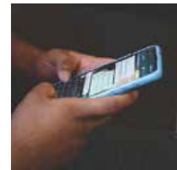
“Son distractor”.

Con globos y obsequios, 53 unidades de recolección de basura del Ayuntamiento de Toluca hicieron la tradicional caravana del Día de la niña y el niño; aparte, grupos voluntarios entregaron juguetes en el hospital del IMIEM para los pequeños internados. TANIA CONTRERAS PÁG. 6