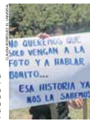
Protestaron en la zona boscosa de San Juan Atzingo.

Ocuilan, Méx.— Con pancartas en mano habitantes del municipio de Ocuilan se manifestaron en la zona boscosa de San Juan Atzingo para denunciar que la tala ilegal continúa pese a los operativos que han implementado para frenar este delito. "En poco tiempo van a desaparecer estos bosques, es lamentable la devastación que están haciendo esos delincuentes porque no son otra cosa, quienes amamos el bosque nos duele pero duele mal que frente a la cara de las autoridades" señaló un vecino. ● Municipios A4