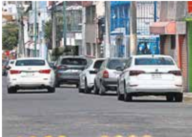
Dependerá del tipo de constancia que se trate, aunque, en general, plantea una disminución.