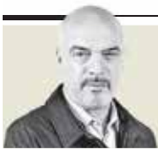
Carlos Puig "Debate en puerta del sector académico con López Obrador" - P. 10