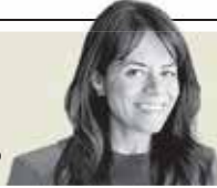
Viri Ríos "Relevo en la FGR y su liga con el Movimiento del Sombrero" - P. 14