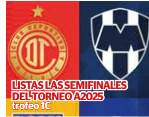
LISTAS LAS SEMIFINALES DEL TORNEO A2025 trofeo 1C