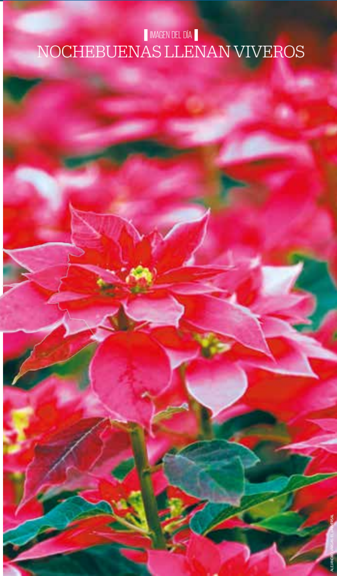
IMAGEN DEL DÍA NOCHEBUENAS LLENAN VIVEROS

Atacamulco, Méx. — Los invernaderos de San Lorenzo Tlacotepec, se tiñen de rojo con la producción de la flor, cuidadas todo el año y protegidas de heladas. Se venden en todo México, con lo que consolidan a la región como uno de los principales productores nacionales. | MUNICIPIOS | A4