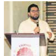
Otro lugar que adaptarán será el Parque Naucalli.

Montoya explicó que, debido a la alta afluencia de personas.