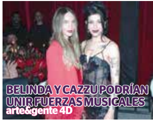
BELINDA Y CAZZU PODRÍAN UNIR FUERZAS MUSICALES arte y gente 4D