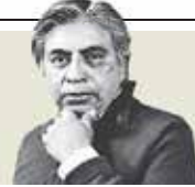
Gerardo Esquivel "Gol, error y figura en la salida de Gertz de la fiscalía" - P. 14

Trámites. Proyectan incorporar nuevos conceptos de cobro, como la constancia con calcomanía tipo exento voluntario, que será de 630 pesos, y el documento de no aprobación tipo rechazo, de $39