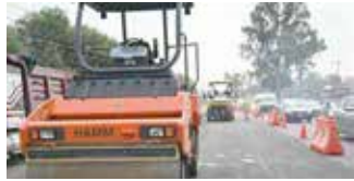
El oriente mexiquense tiene inversión en obras de infraestructura

Explicó que los equipos están en comodato para los municipios durante su trienio, así que la mezcla y la operación, es decir, el material lo ponen los municipios, "el gobierno federal apoya con la maquinaria ya que para que un municipio fuese difícil que pueda adquirir esas maquinarias por el costo que representan, de tal suerte que ésta es un apoyo muy importante para que las 10 de estos municipios estén en mejores condiciones", reiteró.