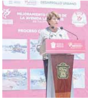
La gobernadora Delfina Gómez Álvarez entregó obras del programa Caminemos Seguras