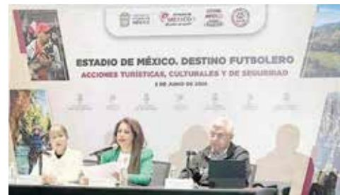
El Estado de México implementará operativos de seguridad y promoción turística durante las actividades relacionadas con el Mundial de Fútbol