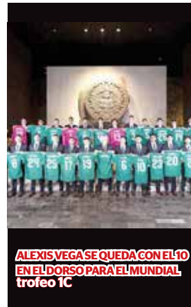
ALEXIS VEGA SE QUEDA CON EL 10 EN EL DORSO PARA EL MUNDIAL trofeo 1C