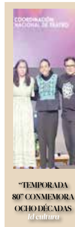
COORDINACIÓN NACIONAL DE TURISMO