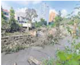
Los habitantes de Hacienda Golondrinas indicaron vivir con miedo en temporada de lluvia.