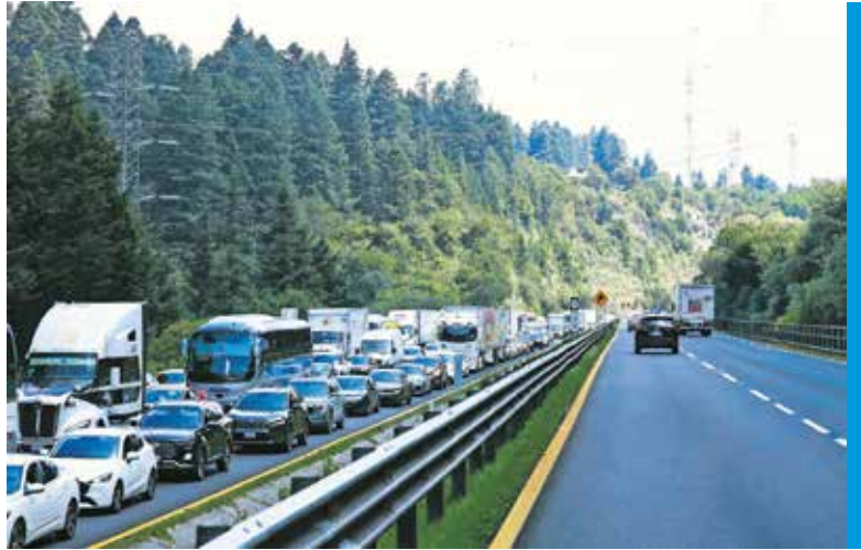
ALEJANDRO VARGAS, EL UNIVERSAL

● La circulación en dirección a la Ciudad de México registró severas afectaciones debido a las labores para retirar toneladas de tierra y material que quedaron sobre la vialidad tras las intensas lluvias del lunes. Automovilistas, transportistas y usuarios del servicio de pasajeros avanzaron durante horas a vuelta de rueda, lo que provocó filas de varios kilómetros y retrasos considerables en el ingreso a la capital del país. ●