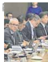
Dentro del análisis se enlistaron las principales obras y acciones.