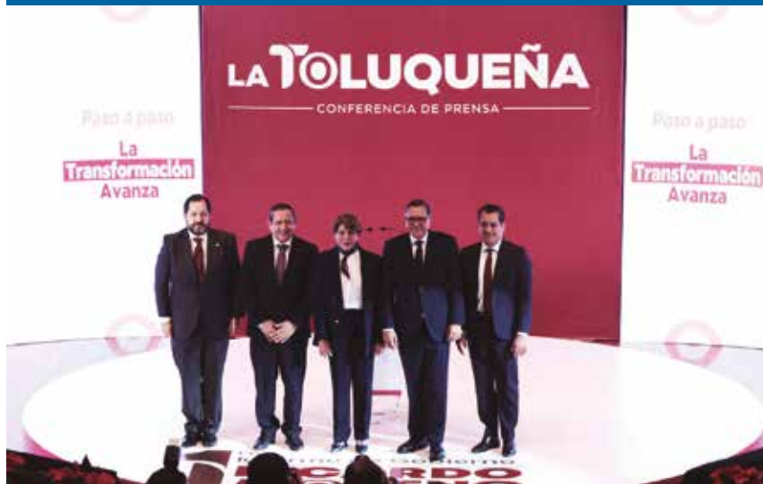
En movilidad segura, eficiente y sustentable, destacó la intervención de 255 mil metros cuadrados de bacheo, equivalentes al 63 por ciento de todo lo realizado en la administración anterior.