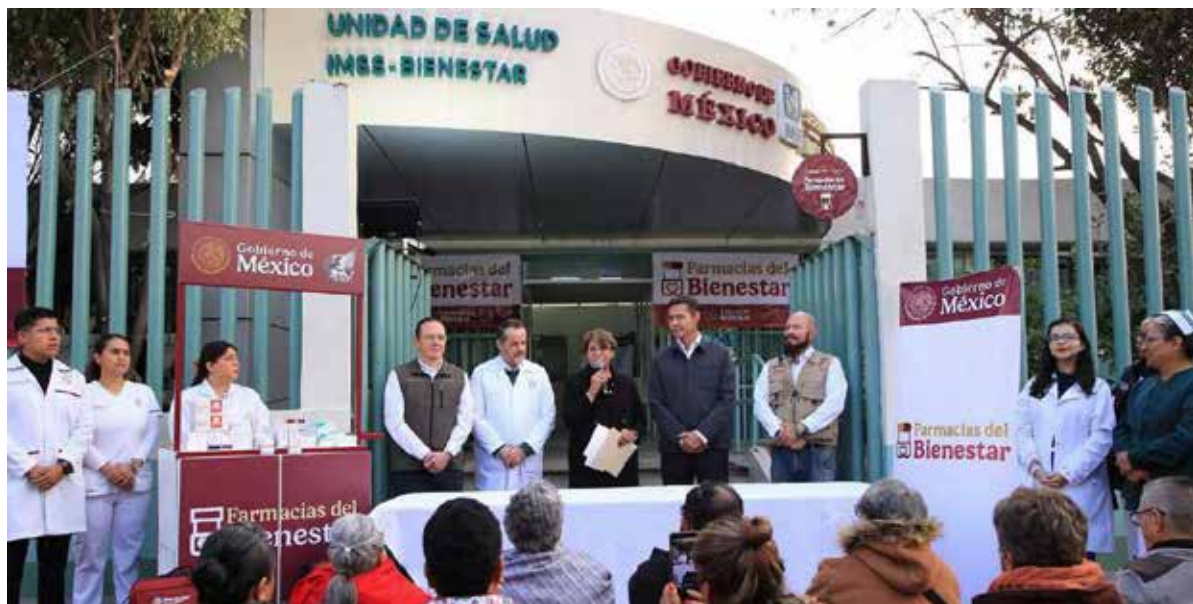
Las Farmacias del Bienestar ayudarán en la cuestión médica y económica; primer estado en operar el nuevo programa nacional.

• A través de Salud Casa por Casa van a tener sus recetas y van a recibir de manera permanente la receta para sus medicamentos, explica Sheinbaum