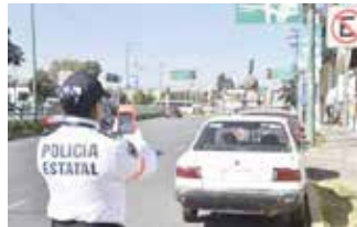
Las multas de tránsito aún no son aplicables

Recordó que el tema de las fotomultas actualmente solo se implementa en municipios del Valle de México.