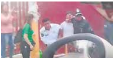
Al llegar al sitio, policías municipales fueron agredidos con piedras y golpes en el exterior del plantel.

● El dato Estudiantes protestaron por presuntos cobros para usar sanitarios y otras inconformidades.