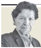
Jorge Zepeda Patterson "Para enero de 2027, a hacer cuentas y las inmolationes" - P. 16