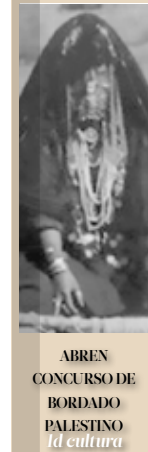
ABREN CONCURSO DE BORDADO PALESTINO Id cultura