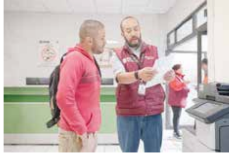
Trámites son gratuitos, personales y sin intermediarios

entidad con la tasa más alta de sanciones por corrupción dentro de las Administraciones Públicas Estatales. Registró 103.1 personas servidoras públicas sancionadas por cada 10 mil.