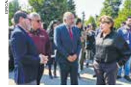
En coordinación con Protección Civil y Seguridad Pública, se mantuvo un monitoreo constante.