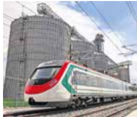
Habitantes de Tultitlán, Tultepec, Zumpango, Jaltenco y Huehuetoca son los principales usuarios.

En su primera semana de operación, se consolidó como una alternativa de conectividad en la zona metropolitana. El servicio recorre 22.9 kilómetros con seis estaciones intermedias y trenes con capacidad de hasta 719 pasajeros, con posibilidad de ampliarse según la demanda. Autoridades destacan su infraestructura accesible, así como sus sistemas de seguridad y operación automatizada. ● Municipios A5