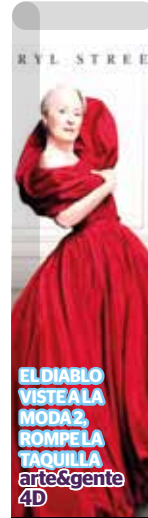
EL DIABLO VISTE A LA MODA 2, ROMPELA TAQUILLA arte&gente 4D

"Si te piden dinero es coyotaje, DiNo al coyotaje. En el Estado de México, los trámites son gratuitos, personales y sin intermediarios. Un gobierno honesto se construye con información y denuncia: si te piden dinero o favores, repórtalo. Infórmate en canales oficiales y denuncia", señala la campaña que ya se difunde en redes sociales.