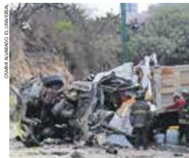
La circulación en la avenida San Mateo permaneció cerrada por más de 10 horas.

De acuerdo con reportes oficiales, el hecho ocurrió alrededor de las diez de la mañana del lu-