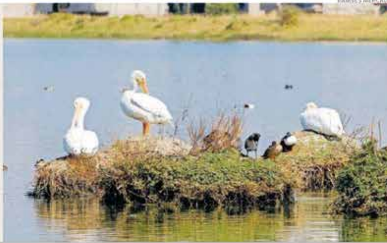
RAMOS DE VÁZQUEZ

El Bordo de Palmillas, al norte de Toluca, recibe este invierno un arribo discreto y escalonado de pelícanos y aves acuáticas. Aunque atraen visitantes, vecinos alertan por el aumento de basura y el deterioro del entorno que pone en riesgo al refugio natural. Pág. 32