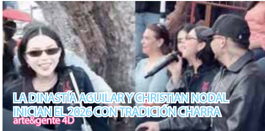
LA DINASTÍA AGUILAR Y CHRISTIAN NODAL INICIAN EL 2026 CON TRADICIÓN CHARRA arte&gente 4D