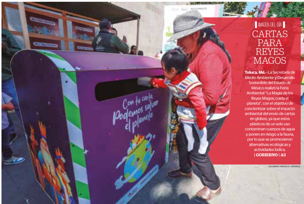
IMAGEN DEL DÍA CARTAS PARA REYES MAGOS

Toluca, Mé. — La Secretaría de Medio Ambiente y Desarrollo Sostenible del Estado de México realizó la Feria Ambiental "La Magia de los Reyes Magos; cuida el planeta", con el objetivo de concientizar sobre el impacto ambiental del envío de cartas en globos, ya que estos plásticos de un solo uso contaminan cuerpos de agua y ponen en riesgo a la fauna, por lo que se promovieron alternativas ecológicas y actividades lúdica.