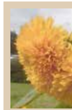
PROYECTO MAZAHUA RESCATA EL USO DE HIERBAS MEDICINALES cultura 1D