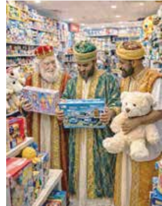
Los pequeños esperan la visita de los Reyes Magos

Según datos de Google Trends, los 10 juguetes más solicitados en México para 2026 son: robots interactivos educativos; sets de construcción temáticos; muñecas y muñecos con realidad aumentada; figuras coleccionables de personajes de series, películas y videojuegos; play sets de aventuras; drones miniconcámara; figuras de personajes de franquicias top, incluyen superhéroes, villanos, protagonistas de animaciones recientes y, este año, las Guerreras K-pop; juguetes de ciencia y experimentos; accesorios escolares temáticos; y peluches y juguetes blandos de colección.