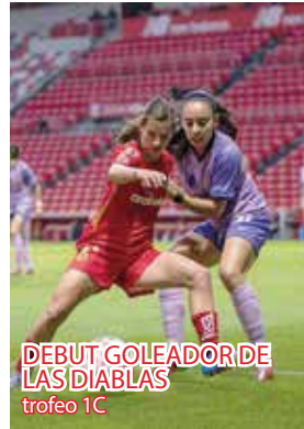
DEBUT GOLEADOR DE LAS DIABLAS trofeo 1C