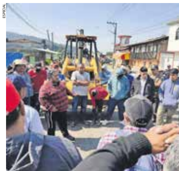
No se tiene registro de víctimas mortales ni lesionados.

—CLAUDIA RODRÍGUEZ Elementos federales fueron atacados durante un punto de inspección en Santa Martha, cuando intentaban frenar el traslado ilegal de madera. La agresión fue repelida sin que se reportaran personas fallecidas o lesionadas, informaron autoridades estatales. Los responsables huyeron tras abandonar los vehículos utilizados. • Municipios A4