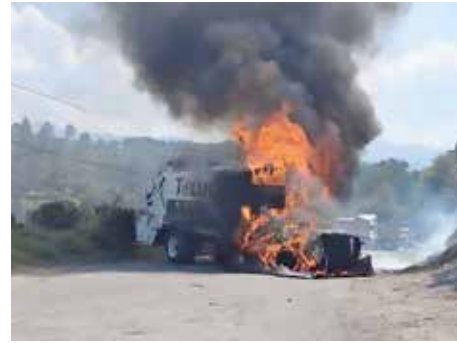
Habitantes de Xonacatlán, de la localidad de San Miguel Mimiapan, cerraron un relleno sanitario