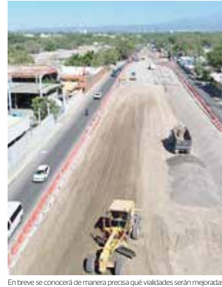
En breve se conocerá de manera precisa qué vialidades serán mejoradas

“Serán las vialidades principales que estén conectando ambas zonas metropolitanas, los aeropuertos, las vías de los principales destinos turísticos del Estado de México, así como en la zona donde los visitantes van a buscar hospedaje. Esto en el entendido que esperamos millones de turistas que van a llegar a este evento, pero además de los trabajadores y los encargados de la logística”.