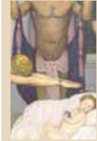
INICIA EL AÑO CON UNA VISITA A LA MUESTRA BAJO EL SIGNO DE SATURNO cultura 1D