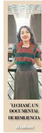
“LI CHAM”, UN DOCUMENTAL DE RESILIENCIA Id cultura