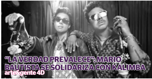
“LA VERDAD PREVALECE”: MARIO BAUTISTA SE SOLIDARIZA CON KALIMBA arte y gente 4D