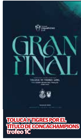
TOLUCA Y TIGRES POR EL TÍTULO DE CONCACAMPIONS trofeo 1C