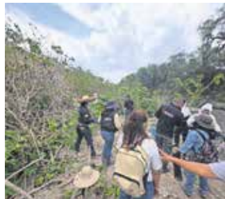
Las acciones se concentraron en tramos de Jalteco, Zumpango y Tequixquiac, municipios por donde cruza el afluente.