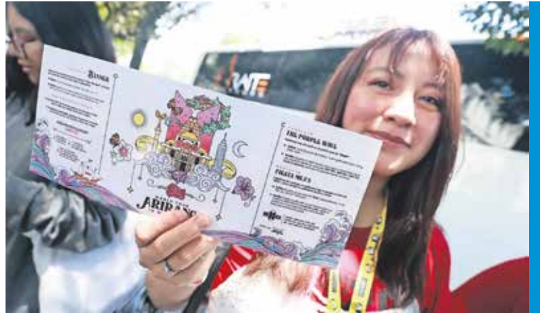
ALEJANDRO VARGAS, EL UNIVERSAL

● Decenas de jóvenes de se trasladaron para asistir al concierto de la agrupación surcoreana BTS, uno de los fenómenos más importantes del K-pop a nivel mundial. Con pancartas, fotografías y vestimenta inspirada en sus integrantes, las seguidoras se reunieron en las inmediaciones de Rectoría antes de partir, para reflejar la pasión del "ARMY". ●