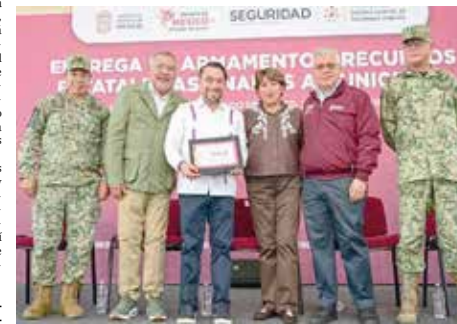
La gobernadora Delfina Gómez Álvarez entregó 92.4 millones de pesos a 85 municipios

permitan a las beneficiarias mejorar su calidad de vida. “Es un programa que sigue una idea muy sencilla, pero profunda, que es contribuir a elevar el ingreso económico de las mujeres