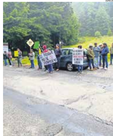
Habitantes de La Cañada y La Cima bloquearon la carretera México-Toluca para exigir acciones contra la presunta tala de árboles.

El gobierno municipal ha mantenido el compromiso de preservar el 65 por ciento del territorio como área verde.