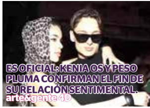
ES OFICIAL: KENIA OS Y PESO PLUMA CONFIRMAN EL FIN DE SU RELACION SENTIMENTAL. artefactos40