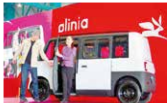
La presidenta Claudia Sheinbaum acompañada por la gobernadora Delfina Gómez presentó Olinia

Toluca Integrantes de Morena en el Estado de México realizaron una concentración en el municipio de Metepec para expresar su respaldo a las políticas impulsadas por el gobierno federal y pronunciarse en defensa de la soberanía nacional, al tiempo que cuestionaron el desempeño de administraciones emanadas del Partido Acción Nacional (PAN). (MÁS INFORMACIÓN PÁG 4A MIREYA CARTA)