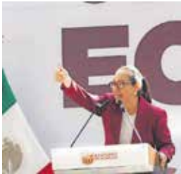
Los trabajos realizados incluyen, inversiones en infraestructura hidráulica.