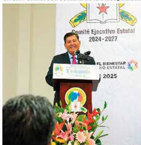
Información Pág. 7

+ Más de 12 mil personas, fueron testigos del avance presentado por el alcalde Metepecense quien -dijo-, la verdadera fuerza de Metepec reside en su gente, y refrendó su compromiso con sus habitantes para conseguir el bienestar que todos desean.