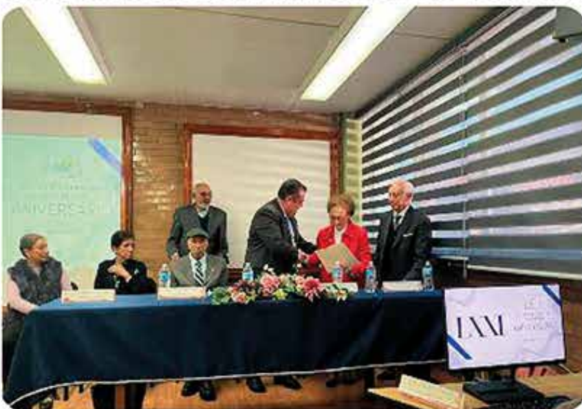
Información Pág. 5