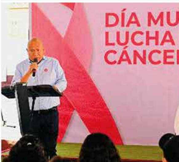
Información Pág. 4