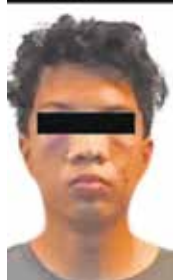
El joven fue recluso en el Penal de Chiconautla, en Ecatepec.

diencia inicial del proceso penal al que será sometido tras el accidente automovilístico.