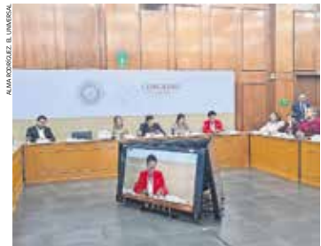
La Comisión Legislativa de Amnistía será permanente y su función será dar continuidad a las solicitudes que se registren.

Tras 24 años sin un marco específico, comisiones legislativas integraron 15 iniciativas para crear un nuevo ordenamiento que prioriza la prevención, la atención a población sin seguridad social y la coordinación entre instituciones. La propuesta incluye salud mental, Interrupción Legal del Embarazo y regulación de centros de adicciones, además de fortalecer servicios médicos y reducir rezagos en la entidad. ● Gobierno A3