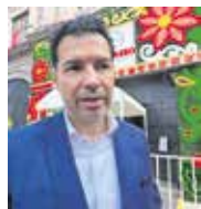
El combate a la pobreza es el rubro en el que han avanzado.

En ese sentido, indicó que si bien, a nivel nacional se habla de que 13 millones salieron de la pobreza, en la entidad son cerca de 2 millones, registrando un avance promedio del 11.5 por ciento.