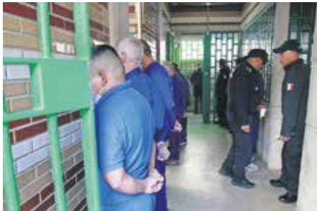
Castañeda Camarillo reconoció que se analizan grabaciones de videovigilancia y se indaga la posible complicidad de personal interno, así como el apoyo de una mujer en la huida.