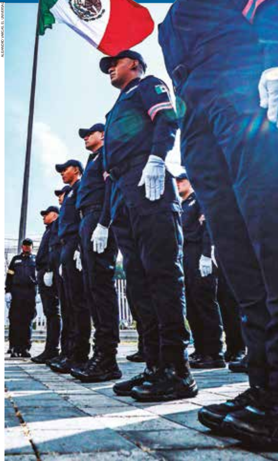
IMAGEN DEL DÍA