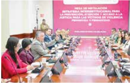
Instalan Mesa de Trabajo para estrategia contra violencia feminicida