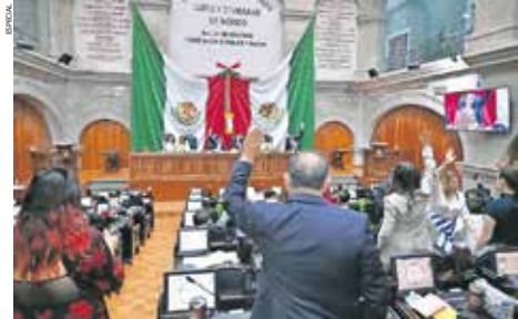
La iniciativa es impulsada por la presidenta Claudia Sheinbaum, para su votación fue enviada por el Congreso Federal al Congreso Local.

La Legislatura mexiquense dio luz verde a la minuta con 60 votos a favor y 15 en contra, con lo que se convirtió en la entidad número 16 en respaldarla. La reforma constitucional busca reducir privilegios en el ámbito político y electoral, al fijar límites al presupuesto de los congresos locales y a las remuneraciones de autoridades electorales. ● Gobierno A3