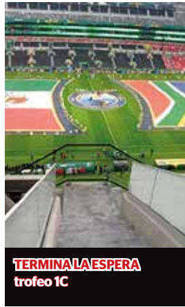
TERMINA LA ESPERA trofeo 1C