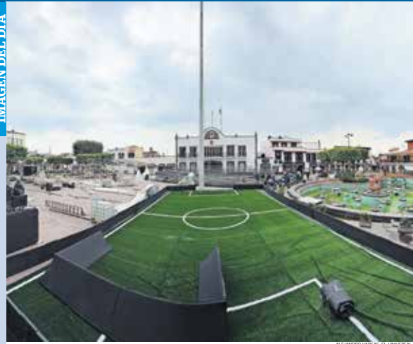
ALFONSO VARGAS, EL UNIVERSAL