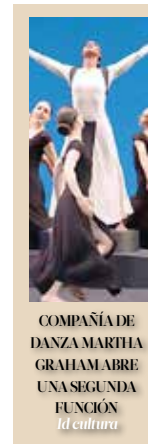
COMPAÑÍA DE DANZA MARTHA GRAHAM ABRE UNA SEGUNDA FUNCIÓN Id cultura