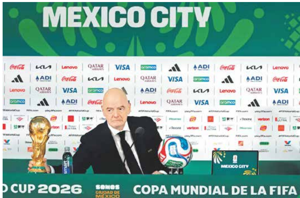
El presidente de la FIFA visitó a Claudia Sheinbaum en Palacio y cenó con empresarios en el Castillo de Chapultepec.