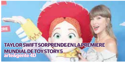
TAYLOR SWIFT SORPRENDE EN LA PREMIERE MUNDIAL DE TOYSTORYS arte&gente 4D