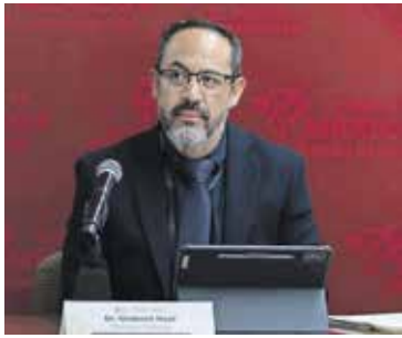
ALFONSO VARGAS, EL UNIVERSAL

Tres se han registrado en Tejupilco y dos casos han sido importados de Veracruz y Guerrero.