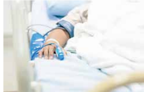
El gusano barrenador aún en el Estado de México