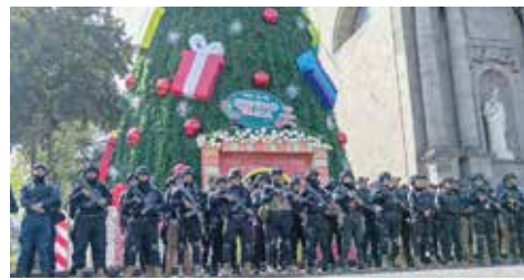
Habrà dispositivo de seguridad en Toluca en estas fiestas

Director General de Seguridad y Protección de Toluca