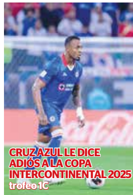
CRUZ AZUL LE DICE ADIÓS A LA COPA INTERCONTINENTAL 2025 trofeo 1C