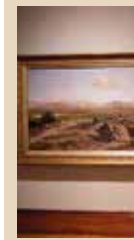
"LA EVOLUCIÓN A TRAVÉS DEL ARTE" cultura 3D