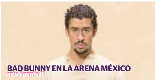
BAD BUNNY EN LA ARENA MÉXICO arte&gente 1D