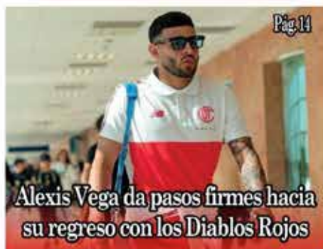
Alexis Vega da pasos firmes hacia su regreso con los Diablos Rojos