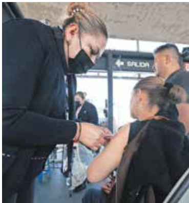
Las inmediaciones de las cuatro estaciones del tren fueron habilitadas como módulos de vacunación.