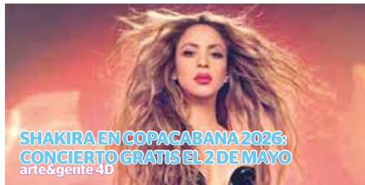
SHAKIRA EN COPACABANA 2026: CONCIERTO GRATIS EL 2 DE MAYO arte&gente 4D