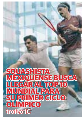
SQUASHISTA MEXIQUENSE BUSCA LLEGAR AL TOP 10 MUNDIAL PARA SU PRIMER CICLO OLÍMPICO trofeo 1C