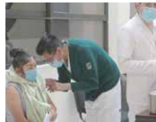
La Secretaría de Salud señala que el brote de sarampión está bajo control

Para las personas de 10 a 49 años que no fueron vacunados, no completaron su esquema o no tienen certeza de tenerlo si se recomienda acudir a vacunarse.