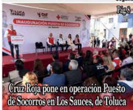
Cruz Roja pone en operación Puesto de Socorros en Los Sauces, de Toluca