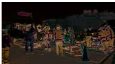
De acuerdo con las primeras indagatorias de las autoridades, el accidente se derivó debido a una falla en el sistema de frenos del autobús.

El dato Doce personas fueron trasladadas a hospitales por lesiones de gravedad.