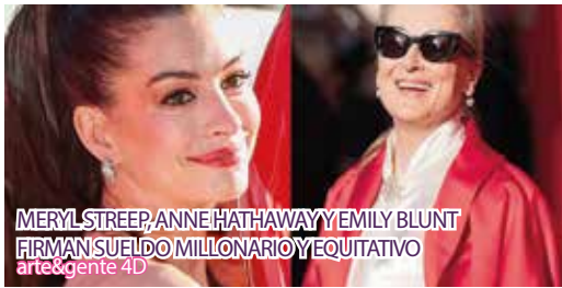
MERYL STREEP, ANNE HATHAWAY Y EMILY BLUNT FIRMAN SU SELDO MILLONARIO Y EQUITATIVO arte&gente 4D