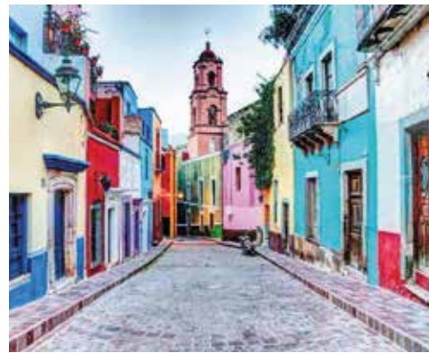
Mundial 2026 impulsará hotelería y gastronomía en Pueblos Mágicos mexiquenses

erán una amplia agenda de actividades culturales, turísticas y comunitarias para mostrar la tradición que dan identidad al territorio mexiquense. La oferta turística se complementa con nuevas rutas temáticas, entre ellas la Ruta en el Corazón Mexiquense, la Ruta Miposita Monarca y la Ruta de la Fe y Espiritualidad, las cuales permitirán a las y los visitantes recorrer distintas regiones y vivir