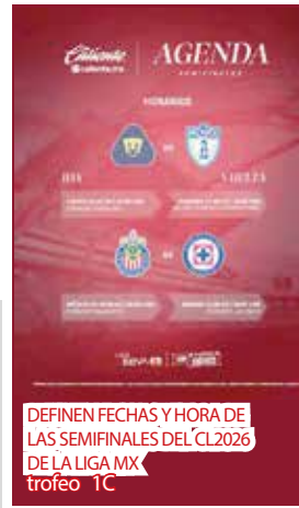
DEFINEN FECHAS Y HORA DE LAS SEMIFINALES DEL CL 2026 DE LA LIGA MX trofeo 1C