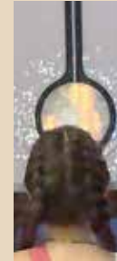
CON "MÁS ALLÁ DEL ALGORITMO" EL CCD RENUEVA PROGRAMACIÓN