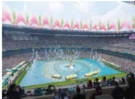
El estado Ciudad de México, hermoso en todo su esplendor para la inauguración del mundial

Cuando terminó, aparecieron los fuegos artificiales que pintaron de verde y