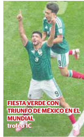
FIESTA VERDE CON TRIUNFO DE MÉXICO EN EL MUNDIAL trofeo 1C