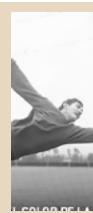
CANAL VEINTIDÓS SE UNE A LA FIESTA MUNDIALISTA Id cultura