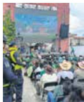
Se reforzó la vigilancia en los 14 Destinos Futboleros.

Toluca, Méx. — La gobernadora del Estado de México, Delina Gómez Álvarez encabezó la Mesa de Paz de este 11 de junio desde las instalaciones del Centro de Control, Comando, Comunicación, Cómputo y Calidad (C5) Toluca, para constatar la estrategia de seguridad en el marco de la justa mundialista, reportando saldo blanco en los despliegues operativos. “Desde las instalaciones del #C5, en Toluca, encabezé la Mesa de Paz de esta mañana. La seguridad de las fami-